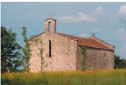
La chapelle Saint-Jean-Baptiste