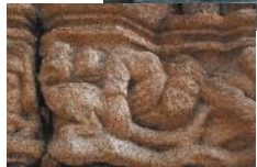
Détail de la frise : le combat contre le Mal