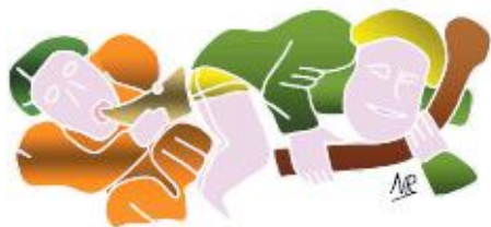
Les Soufflaculs du portail. Il rappellent le Carnaval du Moyen-Age.

A gauche, reconnaissez les soufflaculs, et un damné en enfer attaqué par un chien. A droite, le message spirituel reprenant le Cantique des Cantiques, se termine par un couple, allégorie de l'âme fidèle et de son Dieu.