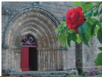
Portail de l'église