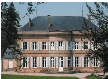
Château de Lachenaud