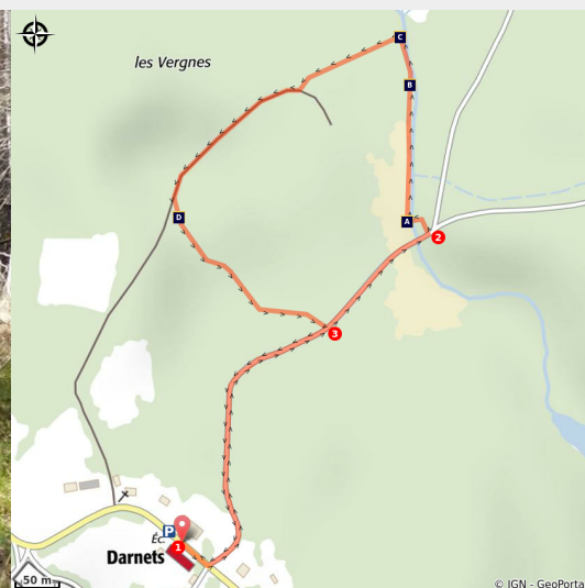
Las Vergnas (CC VEM)

Découvrez la précieuse zone humide de las Vergnas tout en gardant les pieds au sec.