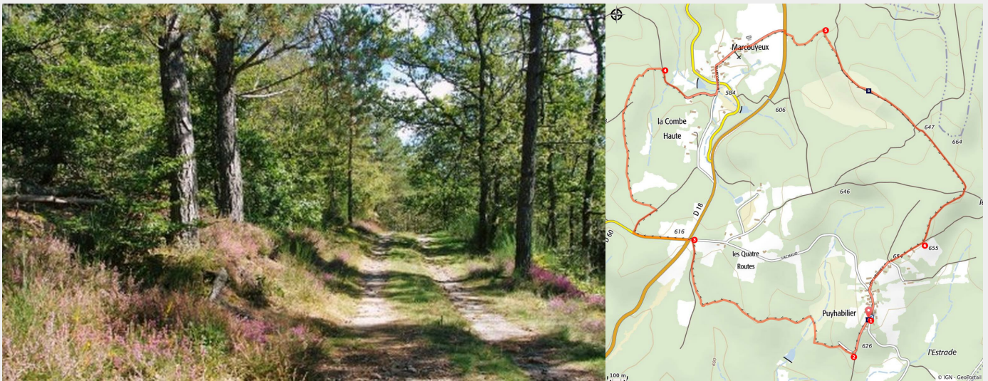
Sur les chemins de Marcouyeux

La Corrèze est maillée par un nombre incalculable de chemins. Véritable traits d'unions entre les hameaux, parcourez-les entre Marcouyeux et Puyhabillier.