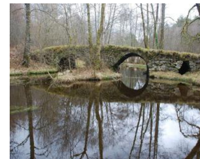
Pont du Châtaignoux