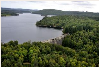
Lac de Vassivière

eaux sont turbinées à l'usine de Peyrat-le-Château et rejetées dans la Maulde en amont de la retenue de Mont Larron. (source EDF)