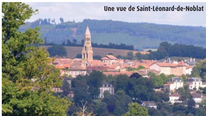
Une vue de Saint-Léonard-de-Noblat

Saint-Léonard, filleul de Clovis, était venu établir un sanctuaire dans la forêt proche. Il reçu du Roi Théodebert, venu séjourner dans le château qui occupait l'éperon rocheux de la rive gauche, un territoire dénommé "Nobilicum", devenu Noblat, et la forêt de Saint-Pauvain, en reconnaissance de la guérison de sa femme. Cette donation étant assortie d'une exemption d'impôts de tous ceux qui habiteraient en ce lieu, la cité se développa rapidement autour de l'église dédiée à la Sainte Vierge édiflée par le Saint. Après sa mort en 559, la renommée du Saint attira de nombreux pèlerins sur la route de Saint-Jacques-de-Compostelle. Dans la vallée étroite, a été construit un pont autour duquel s'est développé le quartier de Noblat. Le pont médiéval attesté dès 1224 remonterait à une époque bien antérieure. Il fut réparé en 1270 par les habitants de Saint-Léonard, dans une forme proche de ce que nous connaissons : moellons de pierre et petit appareil, quatre arches en ogive reposant sur trois piles avec avant-bec. (Source développement-durable.gouv)