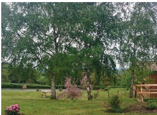
Aire de pique-nique à Négrignas

Augne est un petit village situé à 558 mètres d'altitude. La Vienne est le principal cours d'eau qui traverse la commune.