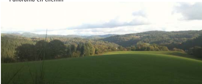
Panorama en chemin