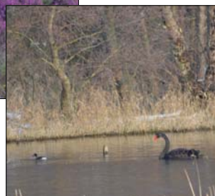
Cygne noir et son petit