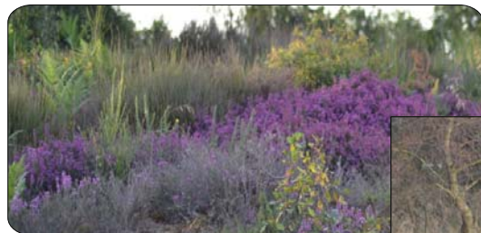
Lande de Murat

11 Au croisement, tourner à droite puis prendre à gauche la route qui ramène au point de départ (laisser à droite la direction de Magnac-Laval).