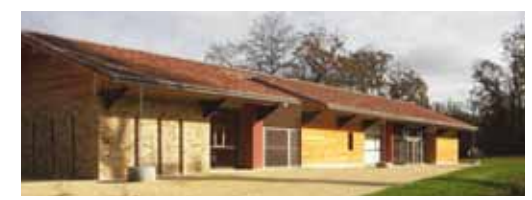
la médiathèque du Père Castor