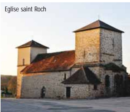
Eglise saint Roch

Reprendre le descriptif du sentier "Le Père Castor" (voir au dos) aux points 4, 5 et 6. Rejoindre ainsi le point de départ au lac de la Roche.