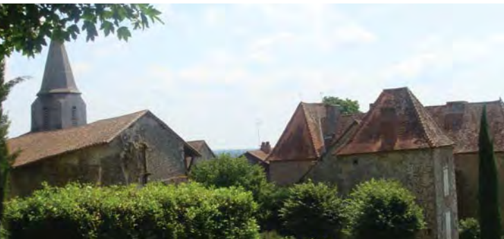
Bourg de Marval