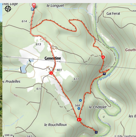
Le Rouchilloux

Sur le site du Rouchilloux, au bord de la Luzège, la nature vous accompagne pour cette balade.