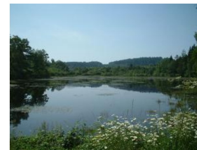
Etang de Faux-la-Montagne