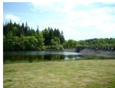
Vue sur la digue