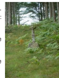
Croix de Fayaud

10 Suivre à droite la route qui mène à Royère et retrouver le parking.