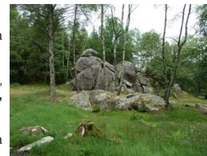
La Roche du Diable