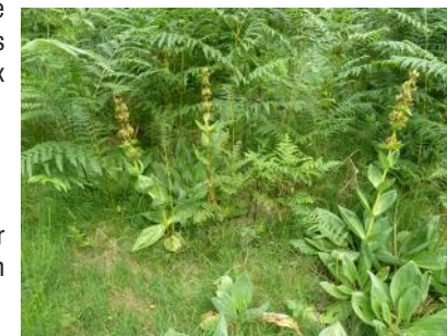
Gentiane jaune - floraison Juillet à Août