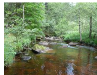
Rigole du Diable

Camping, chalets Pensez à réserver au Pôle Tourisme du Lac de Vassivière