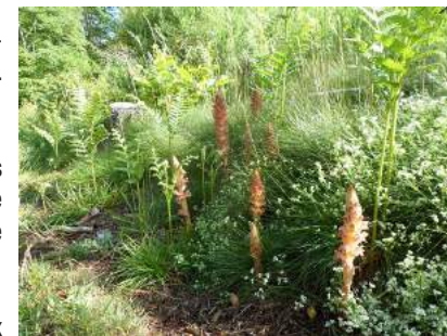
Orobanches-Plantes parasites sans pigmentation verte, feuilles remplacées par des écailles. (source Sépol)

Suivre l'itinéraire de l'aller pour rejoindre le parking.