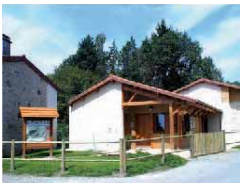
Base VTT des Mas