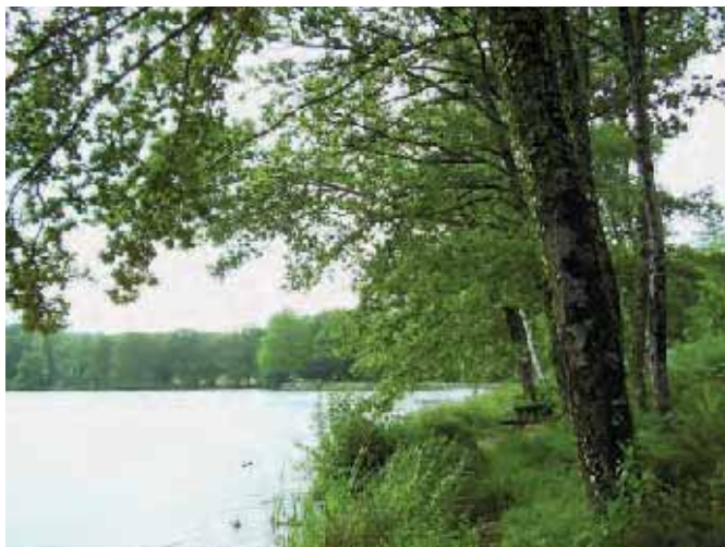
Etang de Breteix