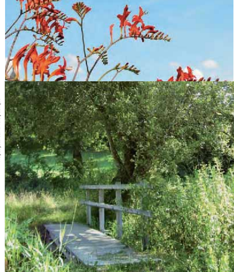
Ne pas jeter sur la voie publique