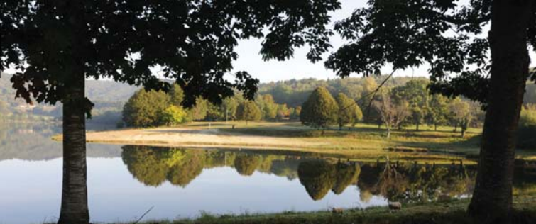
étang de Jonas