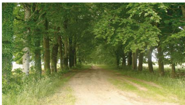
Chemin de Saint-Paul